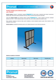
Izolační zástěna proti sálavému teplu tzv. „paraván“

http://www.promatpraha.cz/?kl_hti_zastena