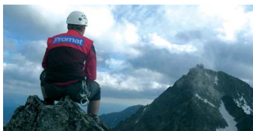
Západní pohled z Kežmarského štítu přes Promat na Lomnický štít.

Jméno firmy Promat je v odborných kruzích velmi dobře známo a dosti pravidelně skloňováno. Málokdo však ví, co znamená. Lze je vykládat dvěma způsoby: Protipožární materiály , což je česká verze, anebo tak, jak je to doopravdy, Progressive materials . Firma byla původně založena jako společnost pro moderní stavební materiály.