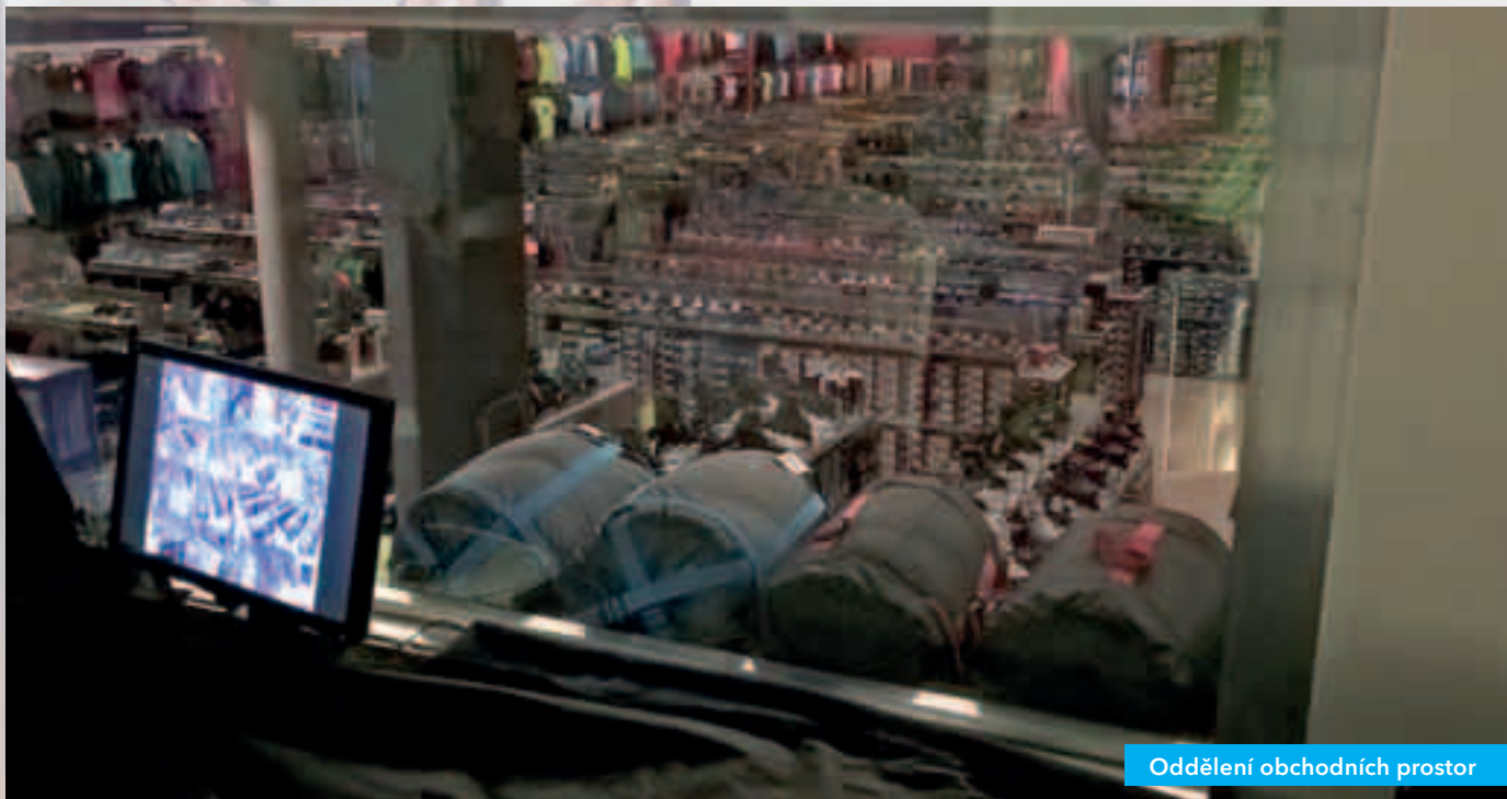
Oddělení obchodních prostor

Skla PROMAGLAS® bývají též součástí konstrukcí, které oddělují prostory nejen co do požární odolnosti, ale i jejich využití (nákupní střediska, letištní haly, operační sály, policejní prostory apod.), nebo jako dekorativní prvek interiéru. Sklo PROMAGLAS® je doplněno o polopropustné zrcadlo, fungující na bázi rozdílu v intenzitě osvětlení mezi jednotlivými prostory.