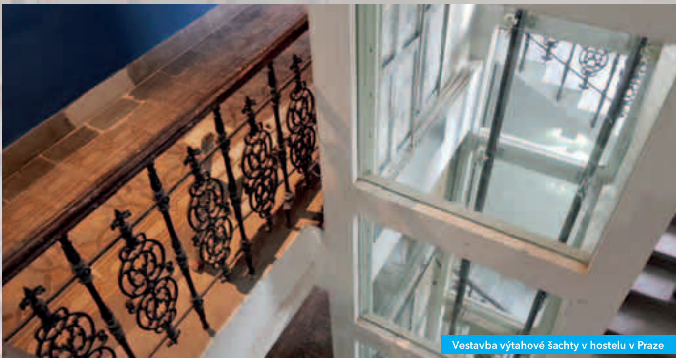
Vestavba výtahové šachty v hostelu v Praze

Skla PROMAGLAS® musí vyhovovat nejen požadavkům na požární odolnost ale zároveň i požadavkům normy ČSN EN 81 - 20, vztahujícím se na mechanickou bezpečnost skleněných panelů z vrstveného skla, plochých nebo tvarovaných. Panely a jejich upevnění musí odolat statické síle 1000 N na plochu 0,30 × 0,30 m bez trvalé deformace a v kterémkoliv místě. Dle ČSN EN 81 - 20 jsou odzkoušena skla PROMAGLAS® EI 30 až EI 60.