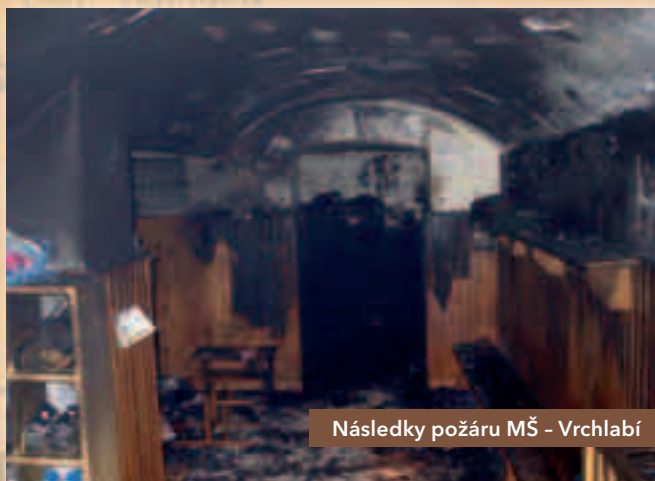
Následky požáru MŠ - Vrchlabí