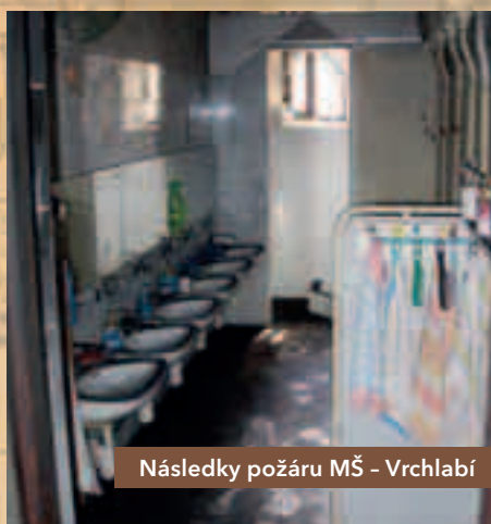
Následky požáru MŠ - Vrchlabí