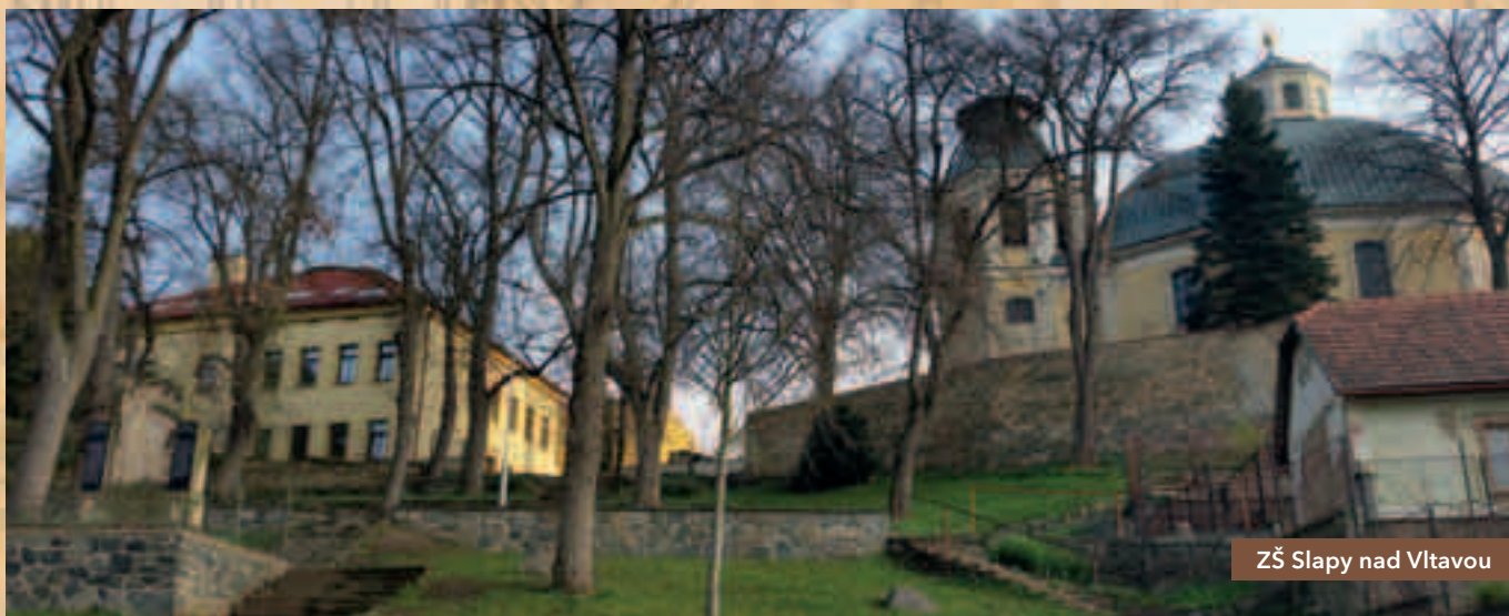
ZŠ Slapy nad Vltavou

ské veřejnosti na prvním místě. Při posuzování požární bezpečnosti vždy vycházíme z platné legislativy a společně s bezpečnostním technikem každoročně vyhodnocujeme bezpečnostní rizika, navrhujeme opatření k odstranění závad a nedostatků a vedení školy je zodpovědné za jejich neodkladné odborné odstranění. Každá škola má vypracované směrnice zaměřené na požární ochranu - dělení budov na požární úseky v závislosti na členitosti budovy i v závislosti na věku dětí a žáků. Pokud se plánuje nová výstavba ve škole, vždy schválení stavby předchází i posouzení stavby a kladné vyjádření hasičů a hygieny. Samozřejmě, že veškeré úpravy zřizovatel předem konzultuje s vedením školy tak, aby stavba odpovídala potřebám školy.“