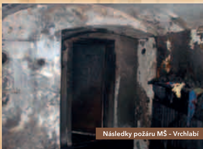
Následky požáru MŠ - Vrchlabí