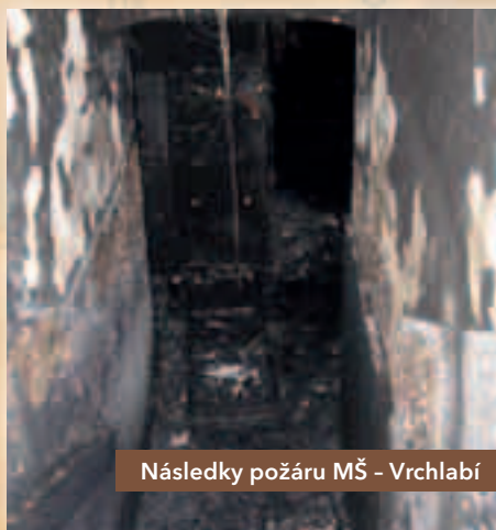
Následky požáru MŠ - Vrchlabí