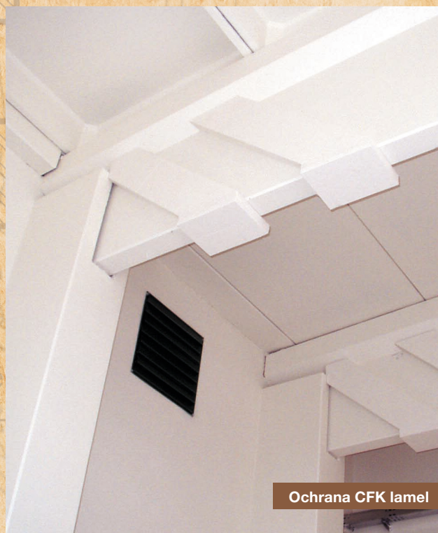
Ochrana CFK lamel