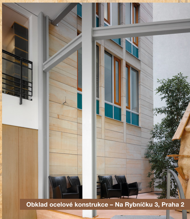
Obklad ocelové konstrukce – Na Rybníčku 3, Praha 2