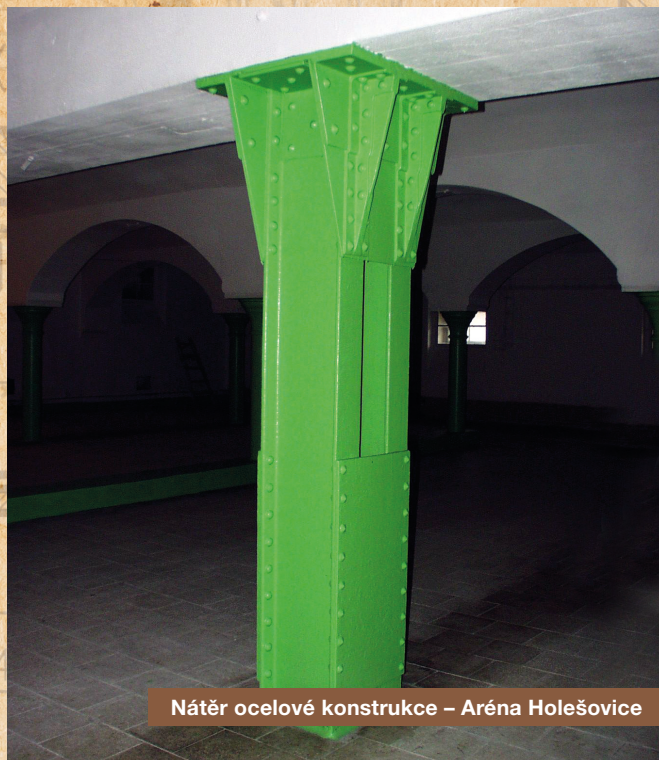
Nátěr ocelové konstrukce – Aréna Holešovice