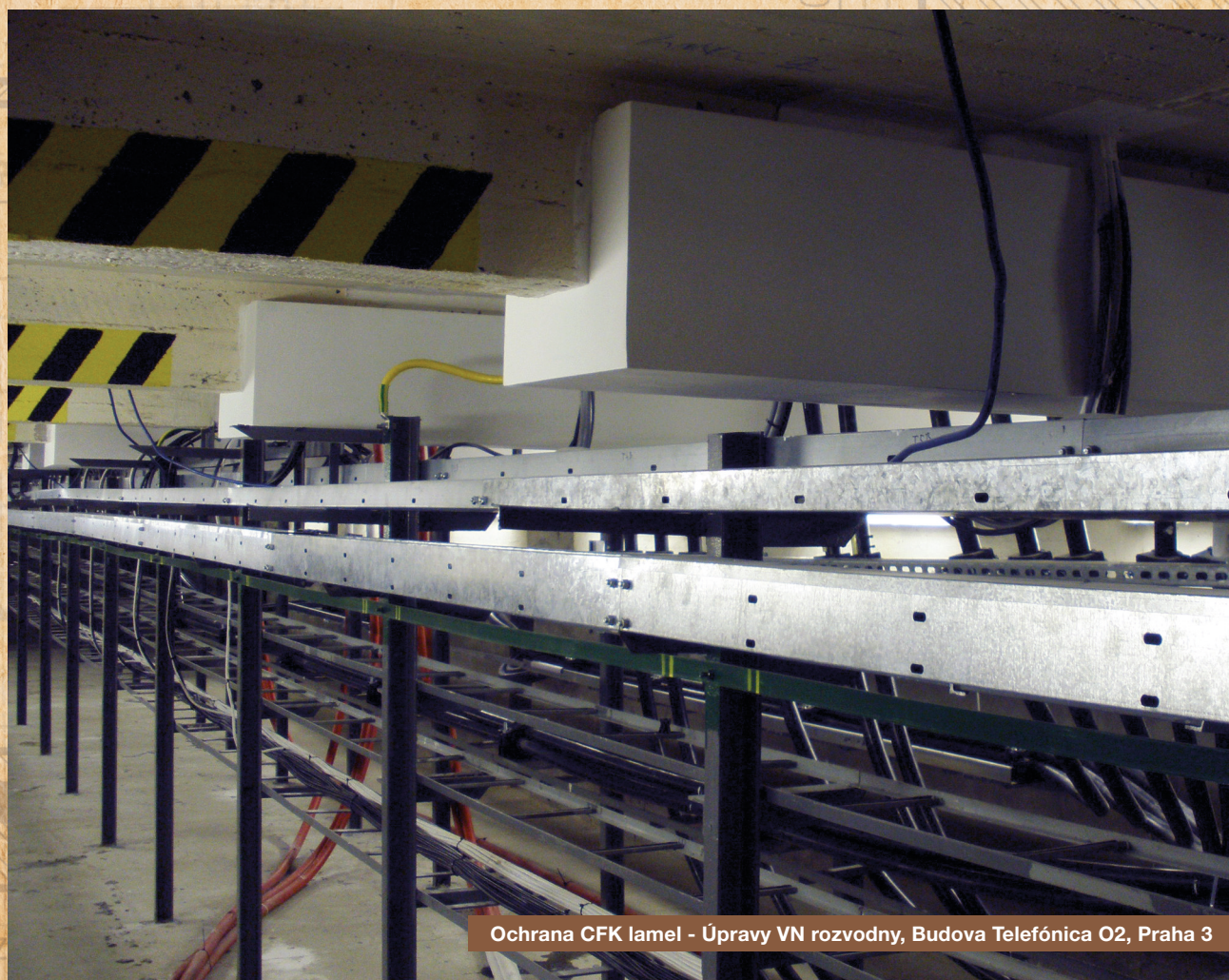
Ochrana CFK lamel - Úpravy VN rozvodny, Budova Telefonica O2, Praha 3